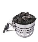
Угольная зола от мангала