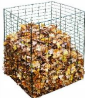
Самодельный компостер из проволоки