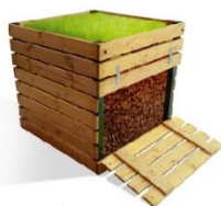
Самодельный деревянный компостер

Компостер можно приобрести готовый, а можно сделать самому