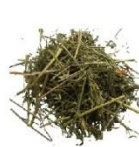
Остатки растений, ботва